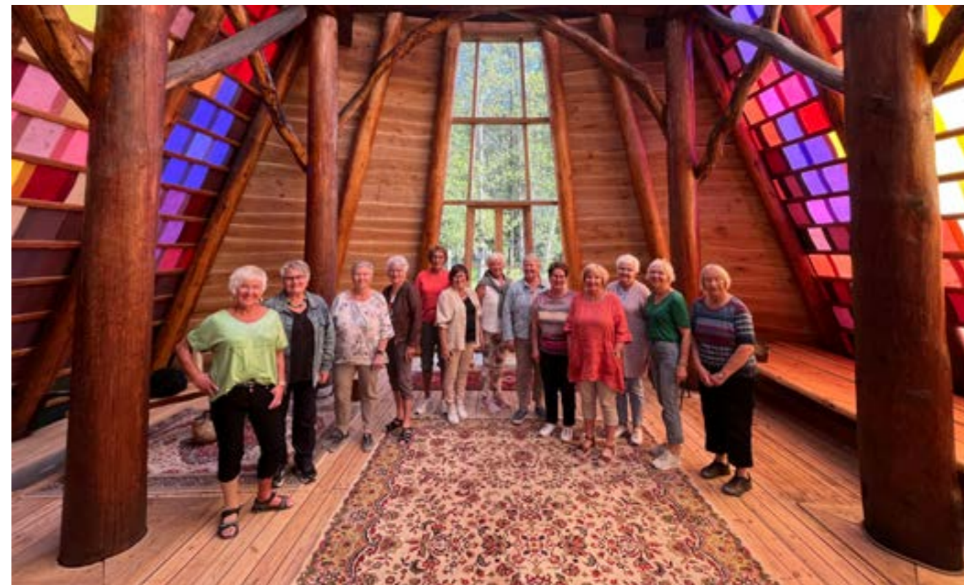
Vi har hatt mange organisasjoner og lag innom på omvisning og foredrag.