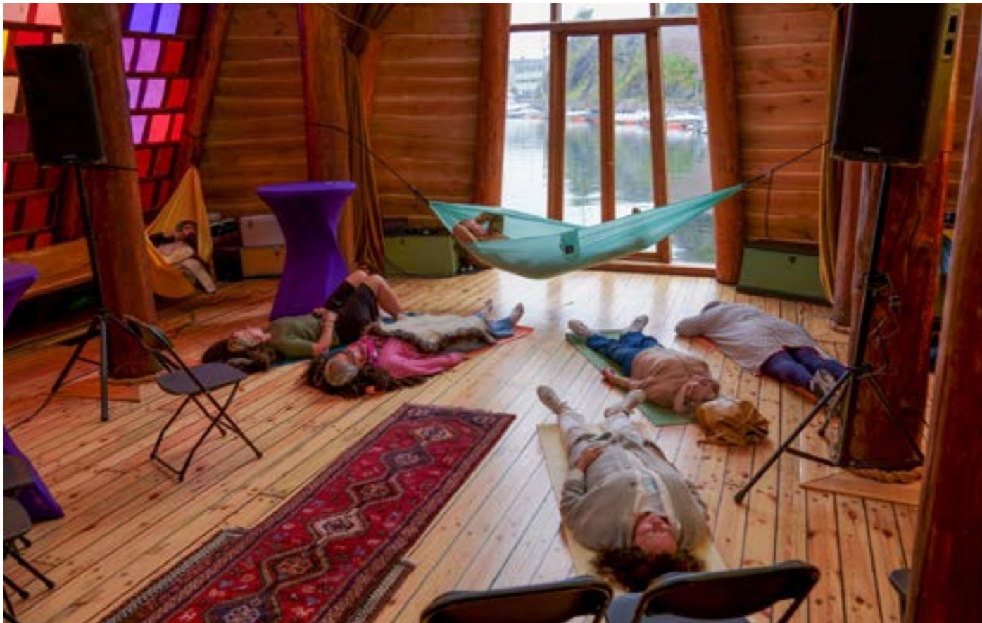
Kavlifondet sponset noe så vakkert som STILLHET. Det var et kjærkomment og svært populært tilbud på den ellers så travle uka.