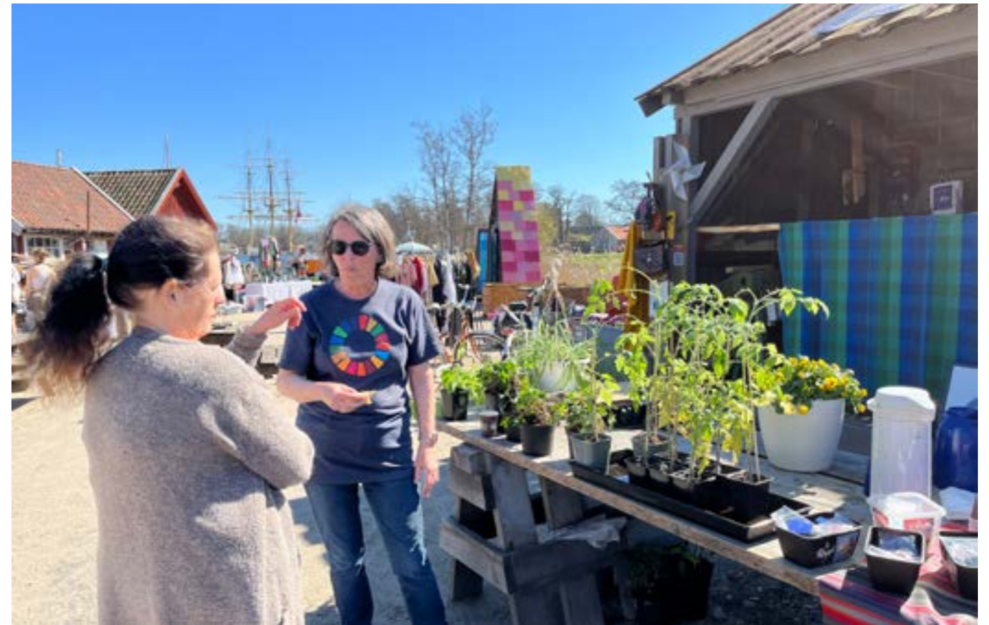
På vårmarket solgte vi noen av plantene som vi hadde dyrket frem fra frø. Det ble en fin inntektskilde for katedralen.