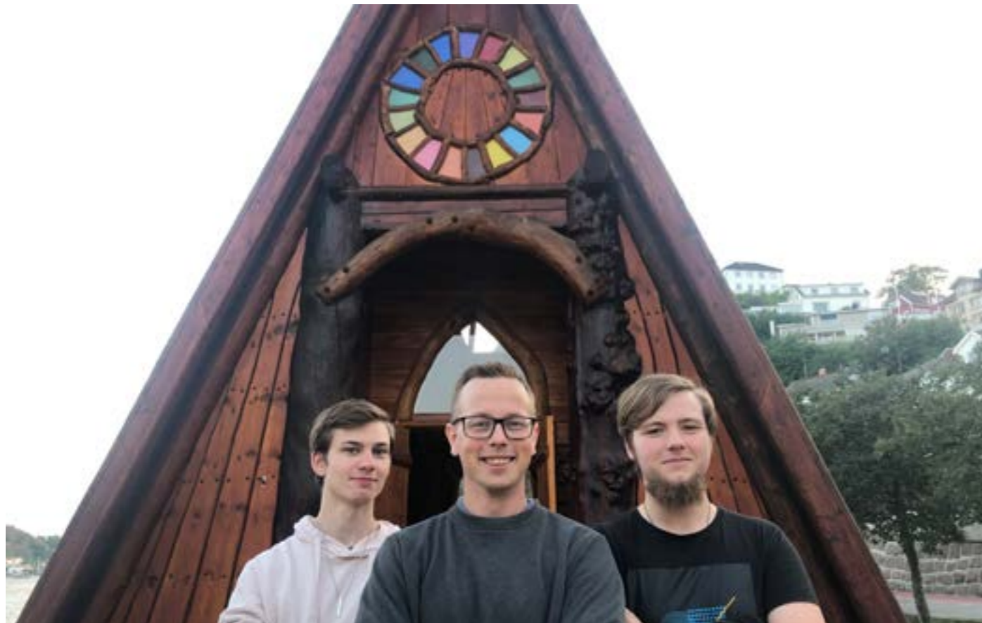
Under uka hadde vi leid inn Ougland Media (ougland.no) som gjorde en fantastisk jobb med å sikre god lyd og streaming.