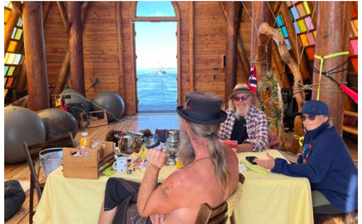
Inne i katedralen hadde mannskapet ordnet seg med bord og stoler, hengekøye m.m. Og det ble disket opp med nyfisket makrell og egg og bacon til frokost.