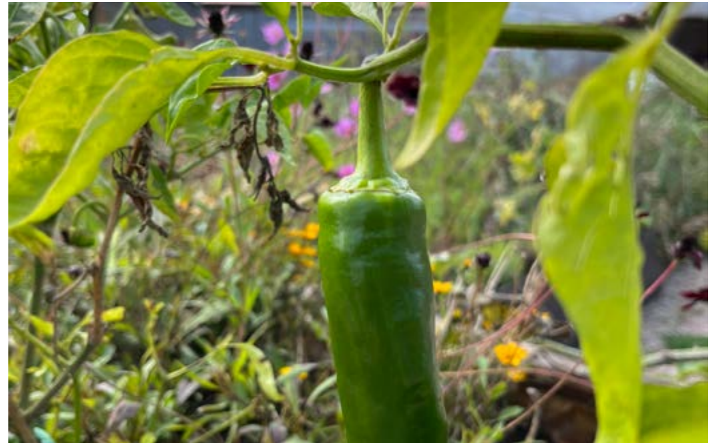
Håpshagen skal inspirere og spre kunnskap om økologisk dyrking, bærekraftig matproduksjon, høsting og tilberedeing av egne råvarer.