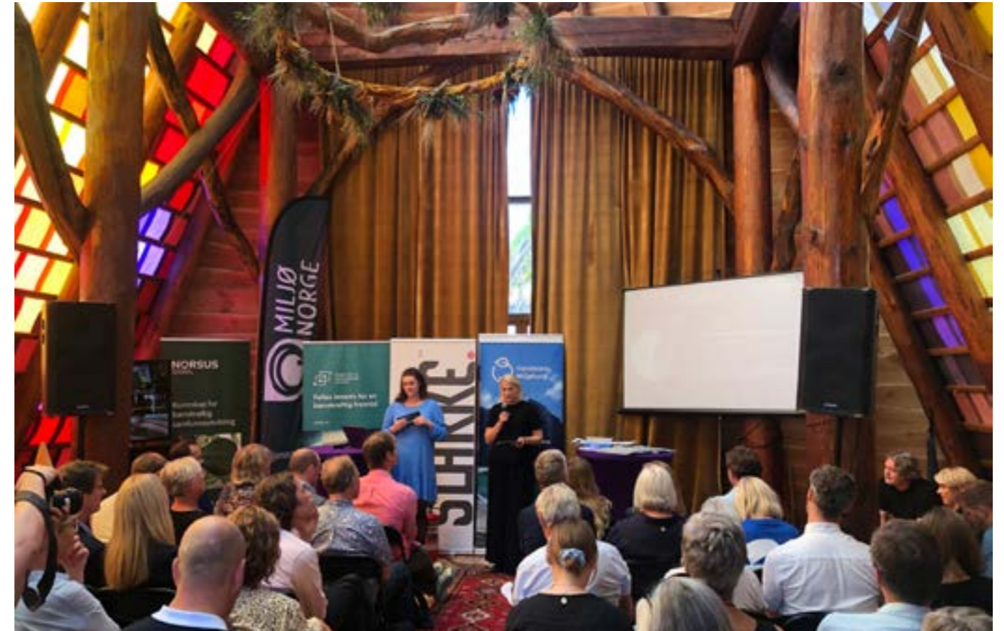
Norsk Senter for Sirkulær Økonomi hadde en hel dag med fokus på sirkulærøkonomi der flere av deres medlemmer medvirket. Takk til NCEE for det gode samarbeidet!