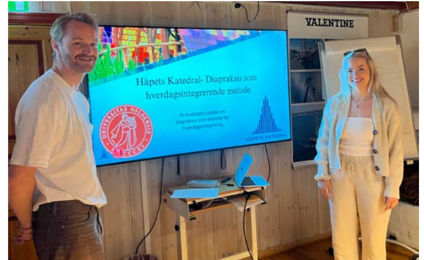
Studentene presenterte funnene for Håpets katedral i mai.