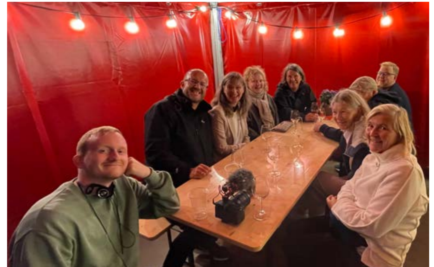
En sliten, men svært fornøyd gjeng som under uka tok seg en hvil i teltet ved siden av katedralen.