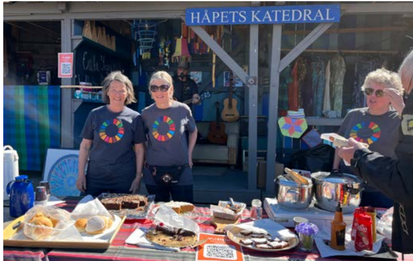
Håpsdamene strålte solgte til inntekt for Håpets katedral.