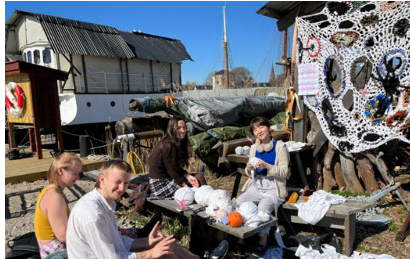
Studentene heklet og koste seg på Håpsplassen.