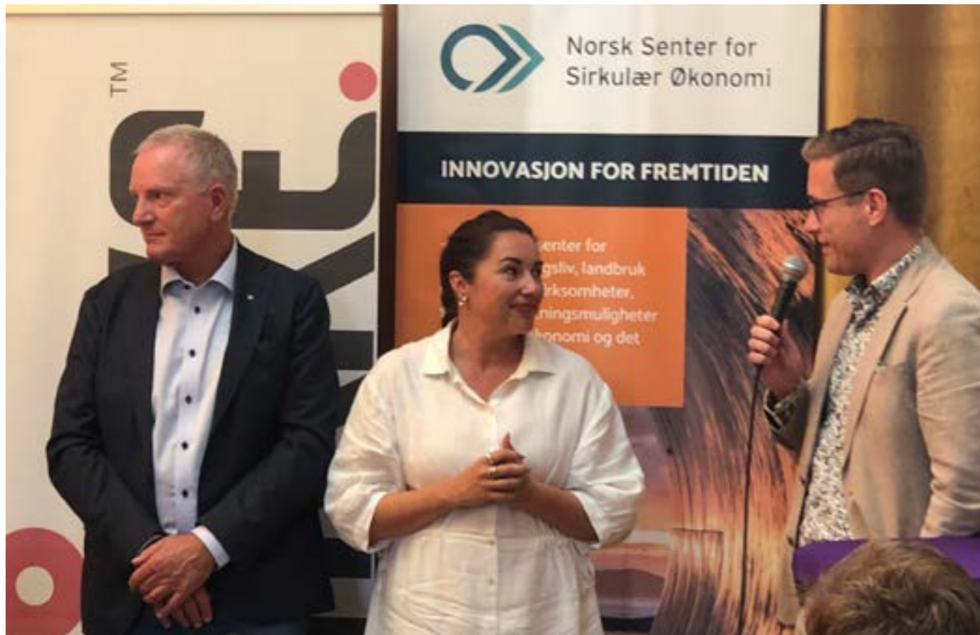
Fredrikstad kommune og Viken fylkeskommune var viktige samarbeidspartnere og bidro i gjennomføringen av flere av arrangementene på Arendalsuka.