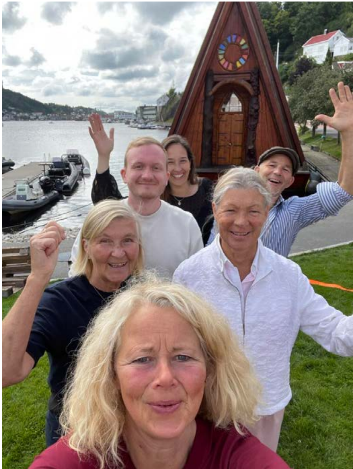
En siste selfie ved Arendalsukas slutt. Herfra reiste vi tilbake til Fredrikstad, mens Håpets katedral ble liggende igjen i Arendal... ut året...