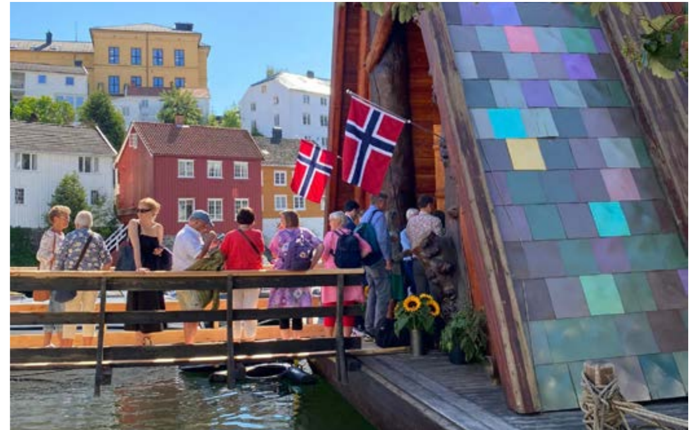
Det var mange som besøkte Håpets katedral på Arendalsuka.